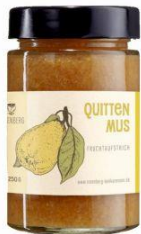
Quittenmus 250g Hersteller: Rosenberger Delikatessen

Zutaten: Sauerkirschen* (Biofrucht Senst), Rohrzucker * Geliermittel: Apfelpektin, Säuerungsmittel: Zitronensaft 76% Fruchtanteil * aus kontrolliert ökologischem Anbau