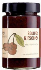
Saure Kirsche 240g Hersteller: Rosenberg Delikatessen