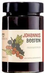
Johannisbeeren 220g Hersteller: Rosenberger Delikatessen

Zutaten: Quittensaft (aus Machern), Rohrzucker *, Vanille*, Geliermittel: Apfelpektin+Säuerungsmittel: Zitronensaft 83 % Fruchtanteil * aus kontrolliert ökologischem Anbau.