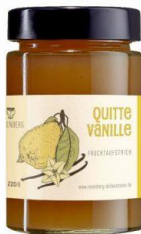
Quitte Vanille 220g Hersteller: Rosenberger Delikatessen

Zutaten: Quitten (aus Machern), Rohrzucker * 82 % Fruchtanteil * aus kontrolliert ökologischem Anbau.